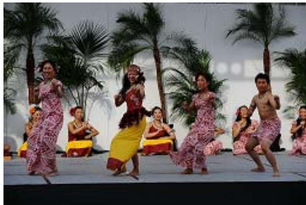
サモア文化協会 サモアナサモア