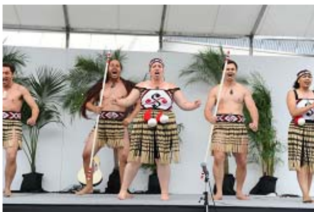
Nga Hau E Wha マオリ民族舞踊と音楽