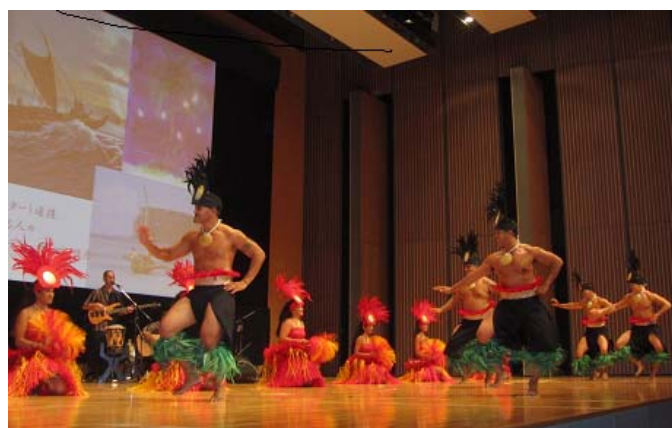
ポリネシアン カルチャーセンター