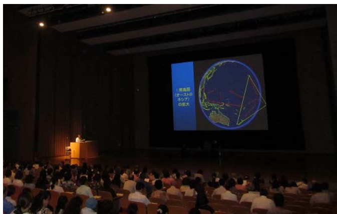
講演:ポリネシアの智慧、Way finding

ハワイのポリネシアン カルチャーセンター(PCC)の文化交流使節メンバーによるハワイ、タヒチ、サモア、フィジー、ニュージーランド、トンガのポリネシアンダンスの実演